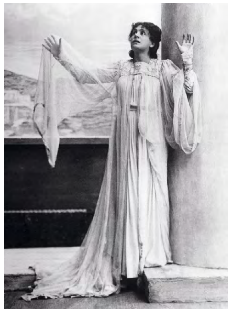
Eleonora Duse, La città morta de Gabriele D'Annunzio