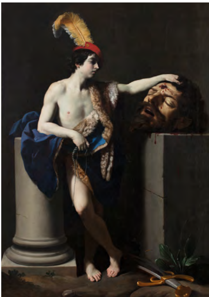
Guido Reni, David tenant la tête de Goliath , 1 er quart XVII e siècle, huile sur toile