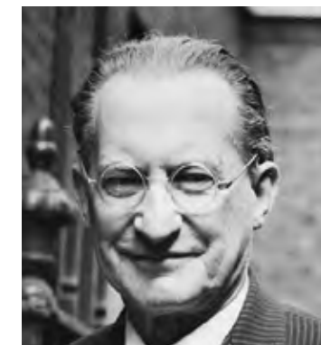
Alcide De Gasperi