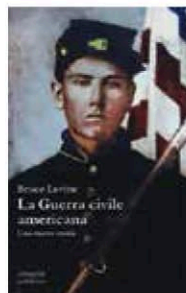
LA GUERRA CIVILE AMERICANA Bruce Levine Einaudi, 2015, 464 pp., 32 €

UNA GUERRA di mondi, quello dell'Unione contro quello degli Stati confederati, una guerra ideologica, culturale, economica e sociale che ridisegnò il volto del Nuovo Mondo creandone a sua volta uno nuovo. Lettere, articoli, proclami con cui l'autore descrive uno scontro umano quanto mai contemporaneo.