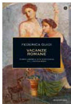
Federica Guidi VACANZE ROMANE Mondadori, 2015, 300 pp., 16 €

Ci sono biblioteche intere sulla storia romana, sull'impero e sulla repubblica, sui condottieri e gli eserciti, sulle istituzioni e i commerci, ma il popolo di Roma, come ogni altro, non viveva solo di guerra e politica: viveva. Attingendo a fonti letterarie, archeologiche e artistiche, Federica Guidi — archeologa e autrice di libri specialistici — apre uno spaccato sulla quotidianità dell'antica Roma, analizzando i momenti di svago della società, la sua ri-