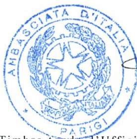
Timbro tondo d'Ufficio

IL PRESENTE AVVISO E' STATO AFFISSO ALL'ALBO DI QUESTA AMBASCIATA IL GIORNO 05 settembre 2022